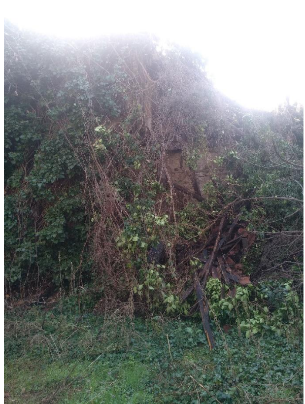
Φωτ. 4 Αριστερά Λεπτομέρεια εισόδου και Φωτ. 5 Ανατολική όψη