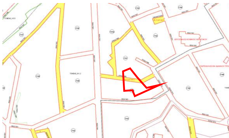
Φωτ. 2 Θέση του κτίσματος σε απόσπασμα ρυμοτομίας

Πρόκειται για διώροφη κατασκευή με ημιυπόγειο κατασκευασμένο από λιθοδομή και πλινθοδομή που φέρει ξύλινη κεραμοσκεπή. Τα μορφολογικά και τυπολογικά στοιχεία του κτίσματος δεν μπορούν να διαπιστωθούν λόγω των τμηματικών καταρρεύσεων και του κατακλυσμού του χώρου με μπάζα και άναρχες φυτεύσεις. Το κτίσμα πάντως προσιάζει στον παραδοσιακό τύπο των αρχών του προηγούμενου αιώνα. Με βάση την ισχύουσα ρυμοτομία το γήπεδο στο οποίο βρίσκεται το κτίσμα διαιρείται σε δύο τμήματα διά πεζοδρόμου. Την παρούσα χρονική στιγμή το γήπεδο δεν έχει πρόσωπο σε οδό και η πρόσβαση σε αυτό γίνεται από στενή λωρίδα γης μεταξύ δύο κτισμάτων επί της οδού 17 ης Οκτωβρίου.