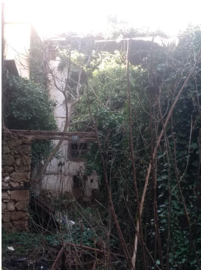
Φωτ. 3 Πρόσοψη του κτίσματος

Το κτίσμα είναι εγκαταλειμμένο και σε ερειπιώδη κατάσταση. Τμήμα της βόρειας πλευράς έχει καταρρεύσει σε γειτονικό χώρο ενώ οι άναρχες φυτεύσεις έχουν κατακλίσει το εξωτερικό και εσωτερικό. Το υλικό ανωδομής και τα στοιχεία πλήρωσης είναι διαβρωμένα σε σημαντικό βαθμό ενώ οι συνδέσεις των δομικών στοιχείων είναι ουσιαστικά ανύπαρκτες. Τμήμα της στέγης είχε καταρρεύσει και είχε αντικατασταθεί από λαμαρίνα σε παλαιότερο χρόνο. Η λαμαρίνα αυτή είναι διαβρωμένη και ετοιμόρροπη επίσης. Ο εσωτερικός και εξωτερικός χώρος είναι κατακλισμένος από μπάζα και απορρίμματα δημιουργώντας ιδιαίτερα ανθυγιεινή συνθήκη για τους περιοίκους. Το κτίσμα κινδυνεύει από ανεξέλεγκτη κατάρρευση.