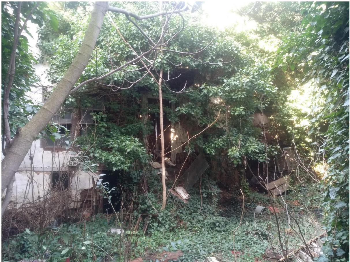
Φωτ. 3 Πρόσοψη